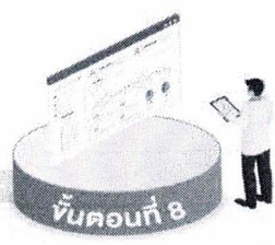
ขั้นตอนที่ 8 Dash Board ประเมินผล ความครอบคลุมการฉีดวัคซีน และอาการไม่พึงประสงค์ (Line OA หมอพร้อม)