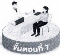
ขั้นตอนที่ 7 จุดตรวจสอบก่อนกลับบ้าน พร้อมรับเอกสาร การปฏิบัติตัวหลังฉีดวัคซีน