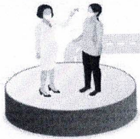
คัดกรอง วัคซีน ใส่หน้ากาก ก่อนเข้ารับบริการ