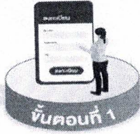
ขั้นตอนที่ 1 ลงทะเบียน (ทำบัตร)