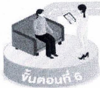
ขั้นตอนที่ 6 พักสังเกตอาการ 30 นาที สแกน Line official account "หมอพร้อม"