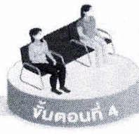
ขั้นตอนที่ 4 รอดูวัคซีน