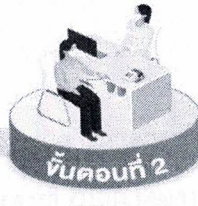
ขั้นตอนที่ 2 ชั่งน้ำหนัก วัดความดันโลหิต